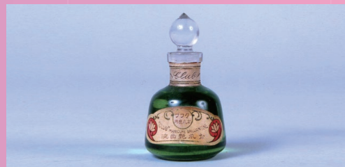
「クラブお爪磨用 お爪艶出液」 1914(大正3)年発売

今では当たり前になっている「時短美容」「ナチュラルメイク」「マッサージ美容法」を啓発する広告を展開し、基礎化粧品を普及してきた。また、トレンドを察知してマニキュアを大正初期に発売。すっぴんパウダーによってスキンケアパウダーという新しいカテゴリーを市場に浸透させるとともに、缶容器をいち早く採用した。クラブコスメチックスは化粧品業界の発展に大きく貢献してきた。