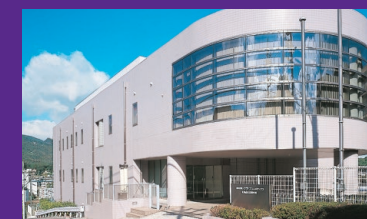
化粧品文化研究所

〒637-0014 奈良県五條市住川町888-4 Tel. 0747-23-1661