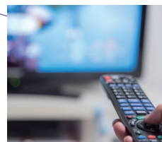
テレビショッピング