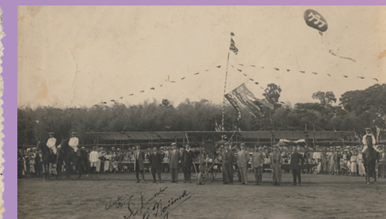
金沢飛行大会の様子 1915(大正4)年