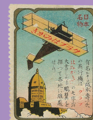
飛行機を使った切手型広告 (大正初期)

そのほか、クラブ化粧品の広告ビラを散布したり、機上よりクラブ化粧品の景品券を散布したという記事が残っている。日本で初めてアドバルーン(広告気球)をあげたのはクラブとも言われている。